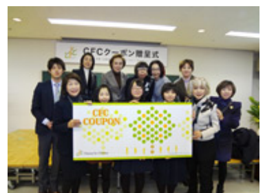
「チャンス・フォー・ガールズ」 プロジェクト クーポン贈呈式開催