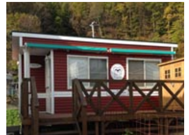
「女川町の女性に元気を！」プロジェクト 「えくぼハウス」開所式