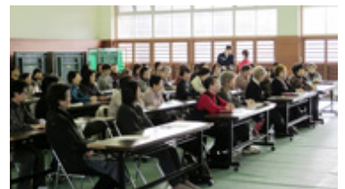
「女川町の女性に元気を！」プロジェクト 講演会と寄贈目録(下)