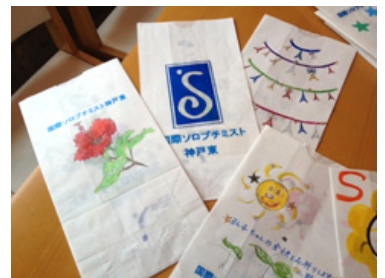
リレーフォーライフ芦屋2013