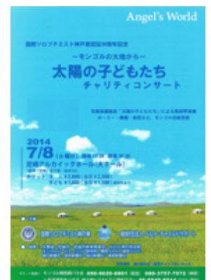
「太陽の子どもたち」プロジェクト 来日チャリティーコンサート