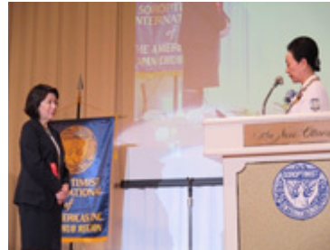
「成功を祝うソロプチミスト賞」 リジョン大会にて受賞