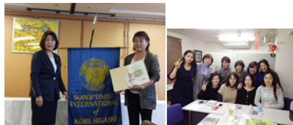
神戸東クローバー賞