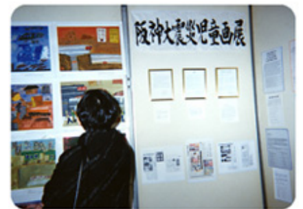
「阪神淡路大震災児童画展」