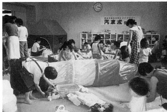
おもちゃライブラリー