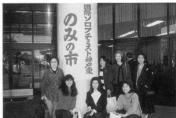
西宮市民会館にて