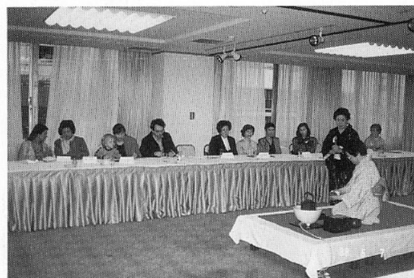
外国の方達とパネルトークのあとお茶を楽しむ